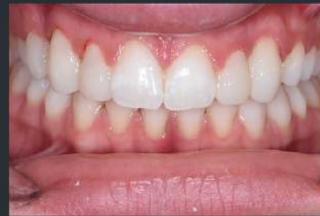
Validation avec le patient du projet par Mock up