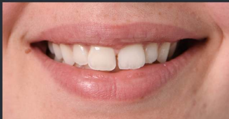
2ème exemple de tâches blanches et colorées