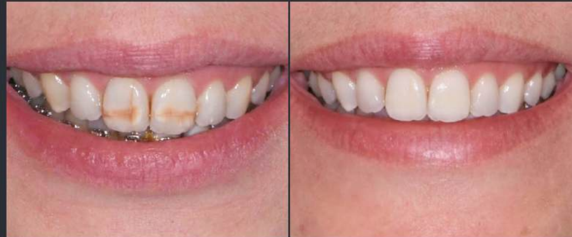
1ère exemple de tâches colorées

Il s'en suivra d'un traitement par Icon +/- résine composite esthétique selon la profondeur de la lésion.