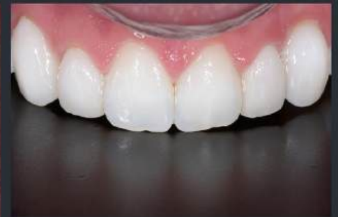
La dent n'est pas encore taillée